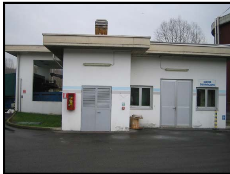
20 Sezione disidratazione