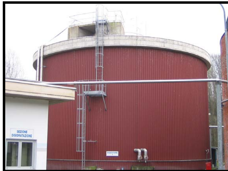
18 Digestore anaerobico attivo