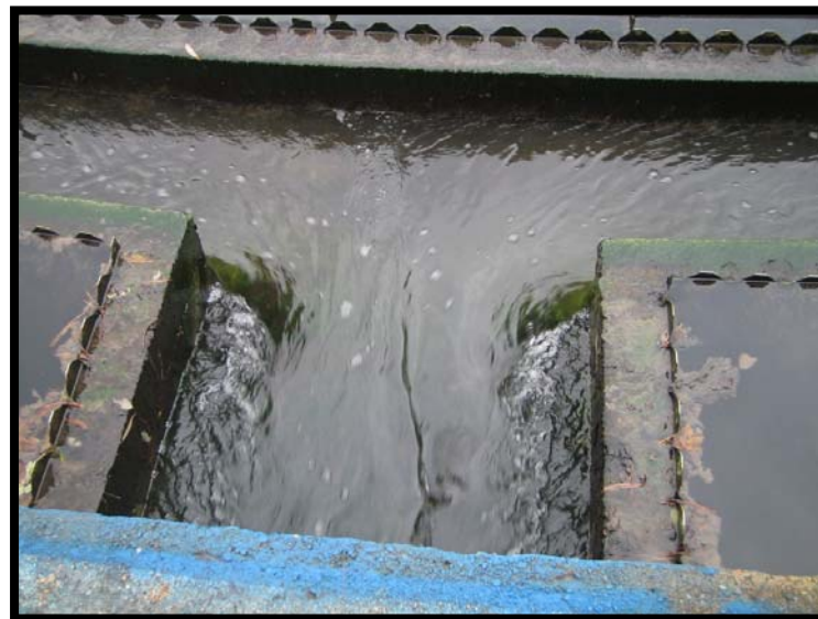
12 Scarico refluo trattato