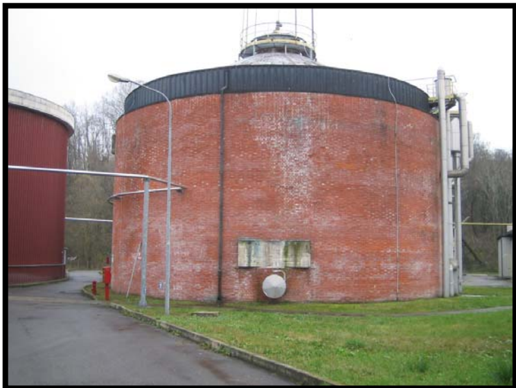
17 Digestore anaerobico non funzionante