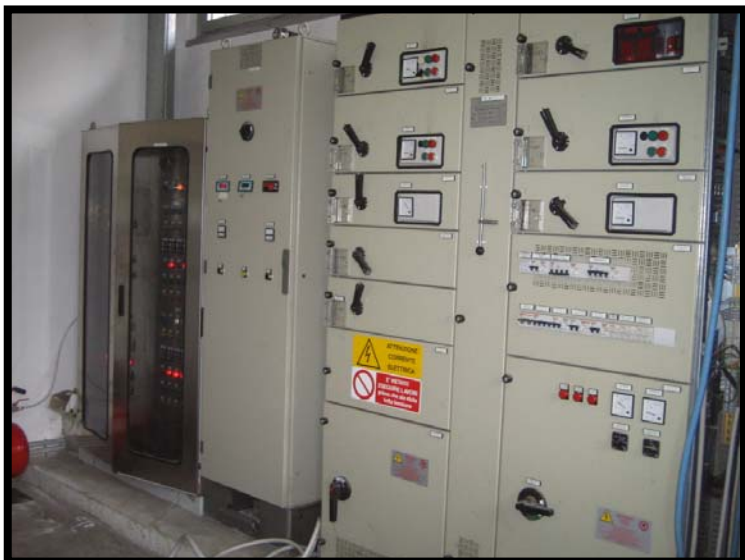
23 Quadro comandi