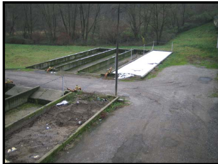
22 Letti di essiccamento non utilizzati