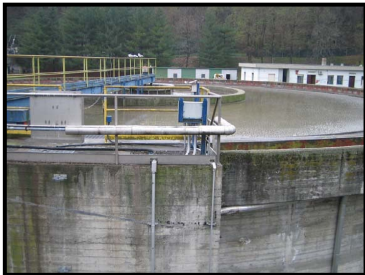
7 sedimentazione primaria