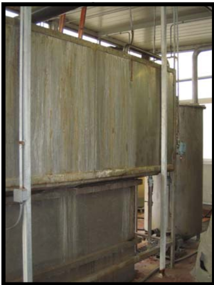
15 Preispressimento dinamico