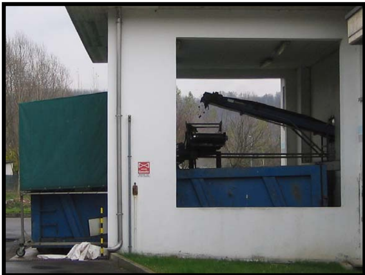
21 Scarico fanghi disidratati