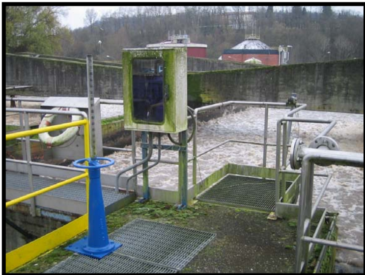
9 Sonda ossigeno ossidazione