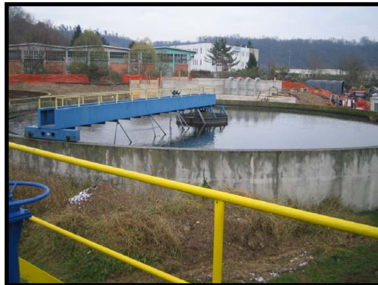
10 Sedimentazione secondaria