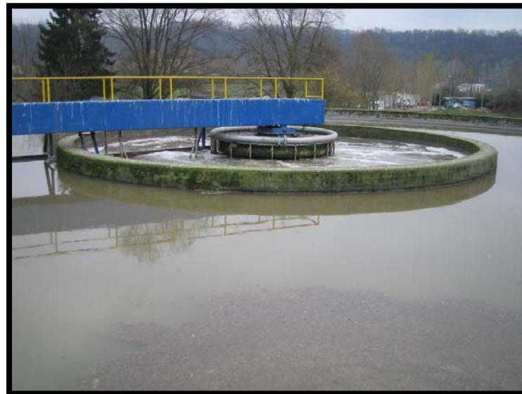
6 Dissabbiatura e disoleatura