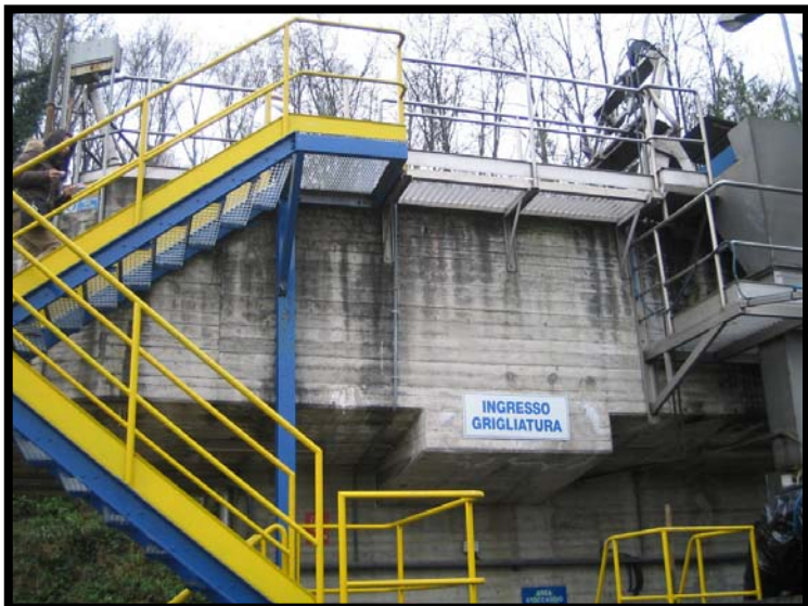
3 Sollevamento e grigliatura