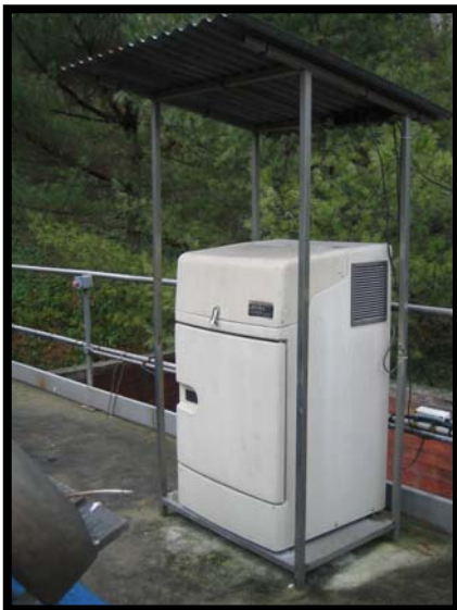
5 Campionatore automatico