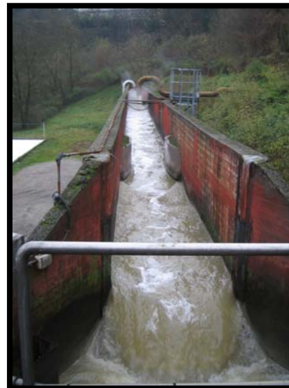
2 Arrivo liquami