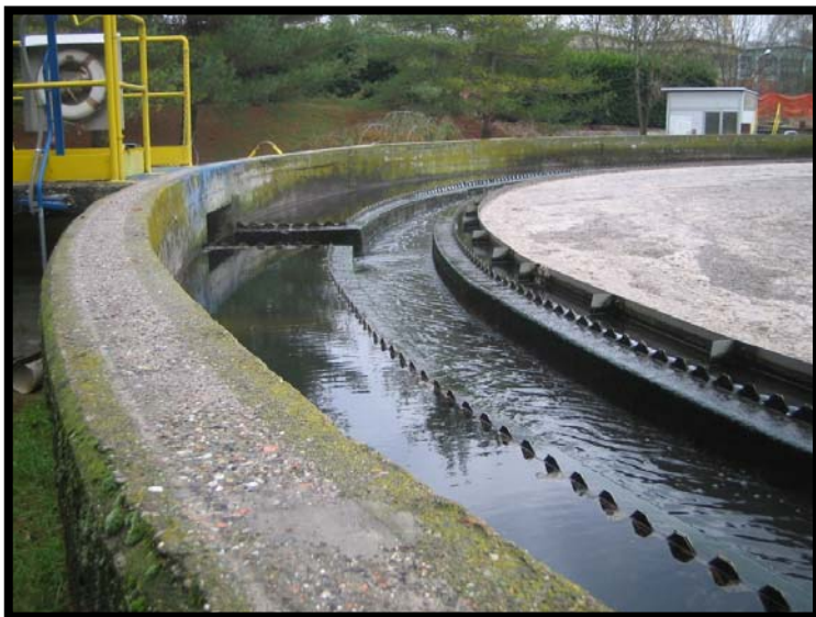
11 Stramazzo sedimentazione secondaria