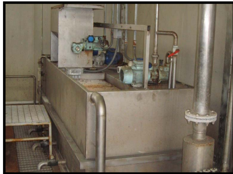
16 Preparazione polielettroliti