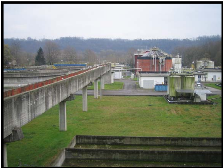
1 Vista d'insieme