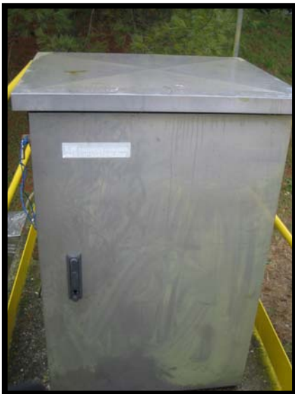
13 Campionatore automatico allo scarico